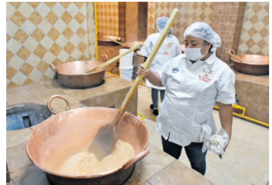
La cajeta de Celaya fue declarada: "El postre del Bicentenario Mexicano".

La cajeta es un dulce tradicional mexicano elaborado principalmente con leche de cabra, fue creada en Celaya, Guanajuato en la época de la Nueva España, y originalmente se le conocía como "dulce de