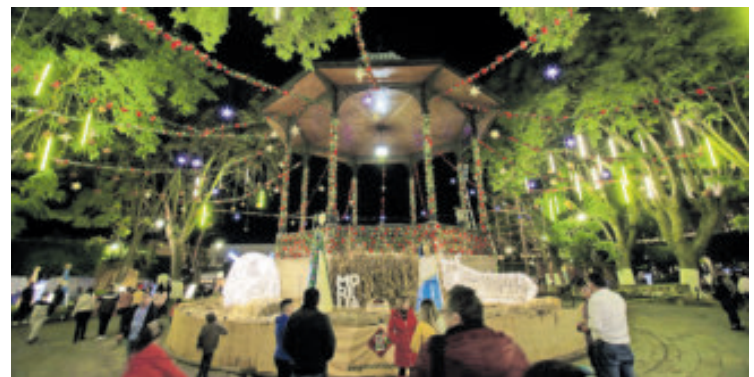
Un toque peculiar a las fiestas.

Por ejemplo, en Tarímbaro se realiza la fiesta del "Takari", una tradición en la cual un grupo de danzantes realiza recolección de heno para elaborar el lecho del Niño Dios, bailando por las diversas calles del pueblo a lo largo de su recorrido.