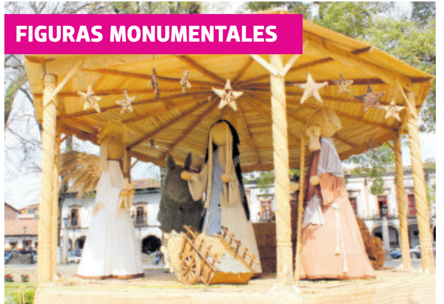
Plazas y jardines son adornadas con figuras monumentales.

Diversas comunidades han hecho suya la tradición cristiana, pero bajo conceptos muy particulares.