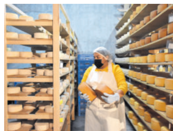
Queso, de los principales productos de la región.

de 1551 fue precisamente por este lugar, por donde llegaron los españoles a fundar Tequisquiapan.