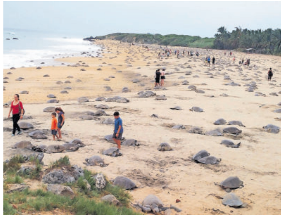
Se han visto hasta 3 mil tortugas desovando.