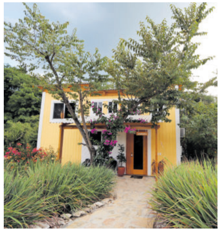
Recién inauguradas las cabañas de Casita Bugambilia.