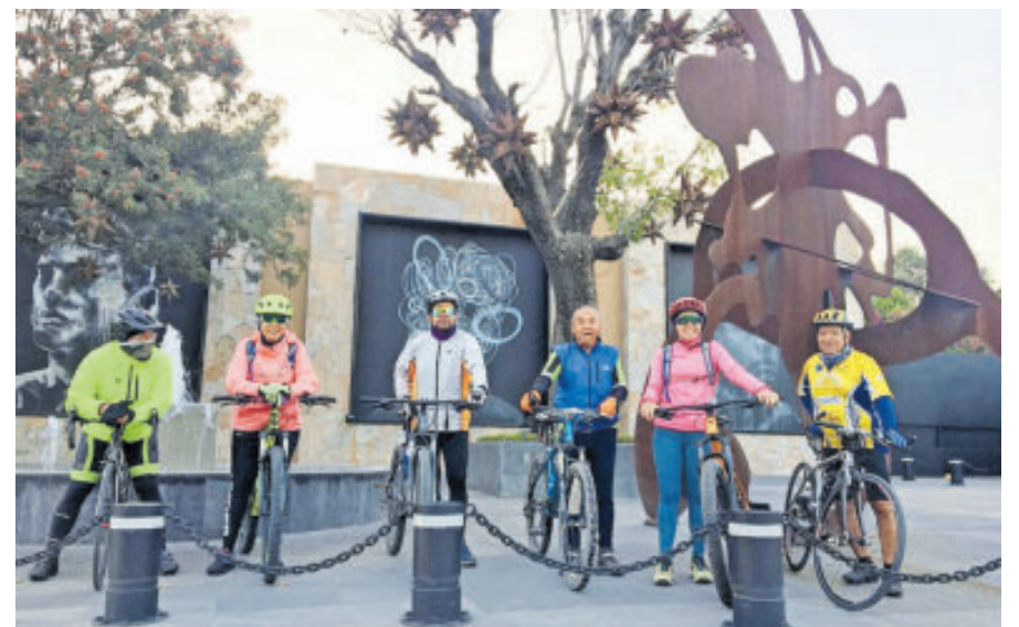
Turismo sustentable con recorridos guiados en bicicleta.

También podrás conocer y tener tu "selfie", del lugar donde nació el sabino o ahuehuate más longevo de la región, probablemente con más de 500 años, pues en el año