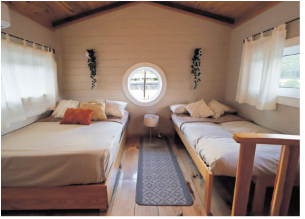
Hospedaje moderno, limpio y muy funcional.