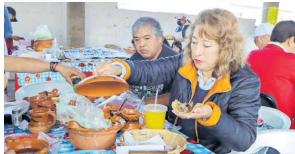
Visitantes locales y turistas.

Boyé es un pequeño pueblo en que se vive la historia, se respira naturaleza, calidez, con gente hospitalaria, trabajadora, luchona y con mucho amor a lo que hacen, pero la verdadera magia de este lugar, se encuentra bajo la tierra, escondida en los hoyos que solo se abren una vez al día, muy temprano, cuando los rayos del Sol