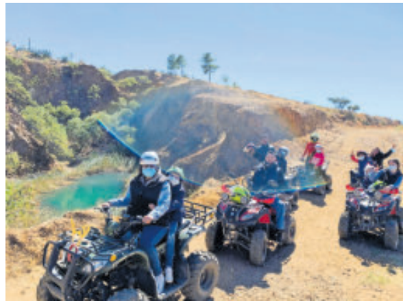
Una opción opción para los aventureros.