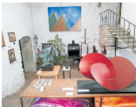
Valiosas piezas son exhibidas.

Entre las pinturas que tiene este lugar hay tanto de autores mexicanos como extranjeros y la mayoría de ellas son del periodo entre las décadas de los cincuentas y los ochentas del siglo XX.