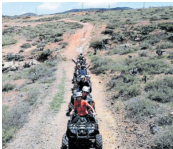
El recorrido de 2 horas por terracería.