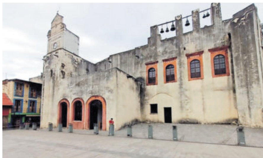
Ex Convento de San Agustín, un espacio de virtud y encuentro espiritual

y cuentan con diversos equipos de guías turísticos.