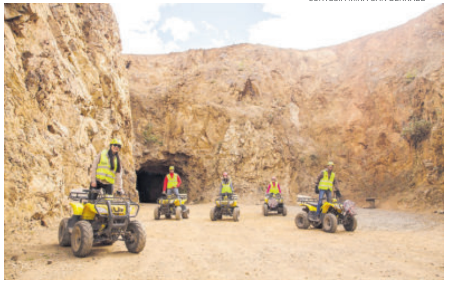
El destino que debes conocer en Zacatecas.