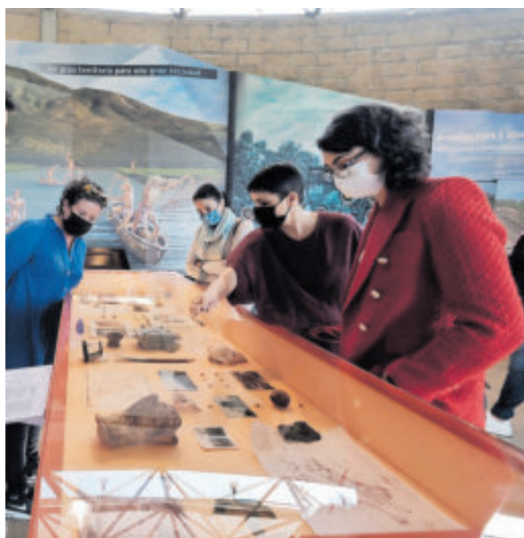
Esta zona es muy visitada en el equinoccio.

Este lugar es una excelente opción para disfrutar especialmente los fines de semana. A la par que puedes realizar un recorrido por las pirámides. El sitio arqueológico es uno de los más importantes del Occidente de México y está abierto a todo público. Cuenta además con los servicios del Centro Interpretativo Guachimontones que anualmente recibe alrededor de 170 mil visitantes al año. Con visita guiada o sin ella puedes recorrer el museo arqueológico donde se pueden observar figuras de cerámica, maquetas de tumbas y fotografías.