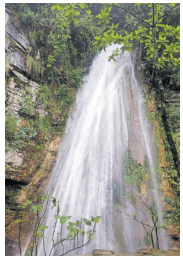
La cascada Los Comales tiene una caída de 36 mts.

SE HA CONVERTIDO en una de las edificaciones coloniales más antiguas y distintivas de la zona Huasteca. Construcción del siglo XVI.