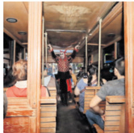
Recorrerás en tranvía las calles.