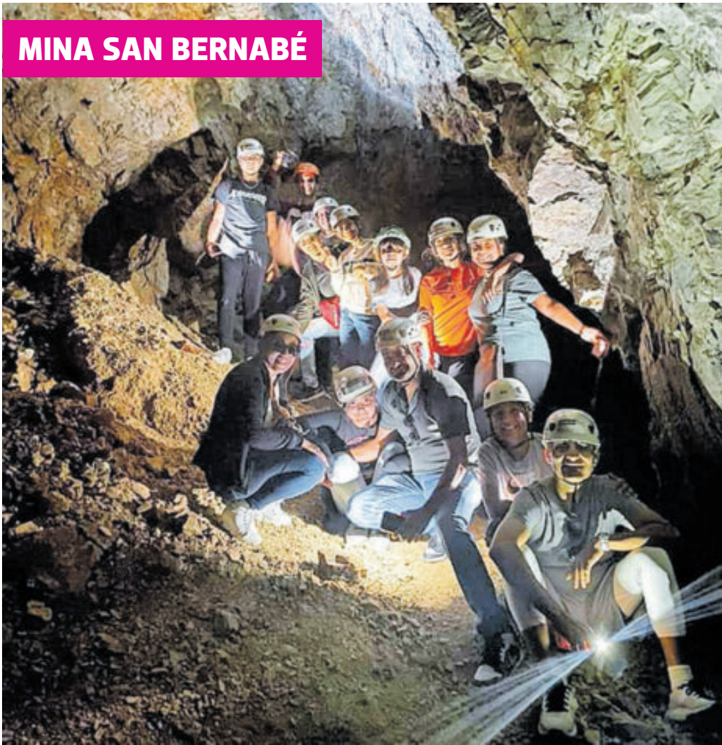
Deslúbrate explorando una de las minas más antiguas.