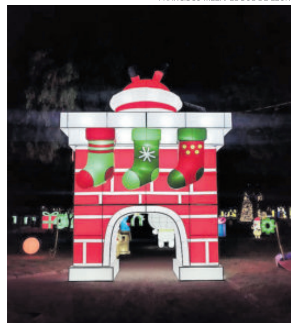
León recibirá a miles de visitantes.

Luztopía ya cuenta con cinco ediciones en Monterrey, donde se ha convertido ya en una tradición esperada de finales de año, al ser un festival cada vez más luminoso y artístico de México, en el que miles de familias no pierden la oportunidad de divertirse.