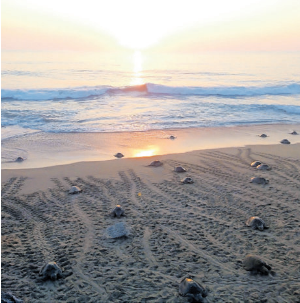
Punta Ixtal es el nombre del campamento que se localiza en la localidad indígena de Ixtapilla.