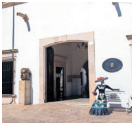
El museo enaltece el grabado.