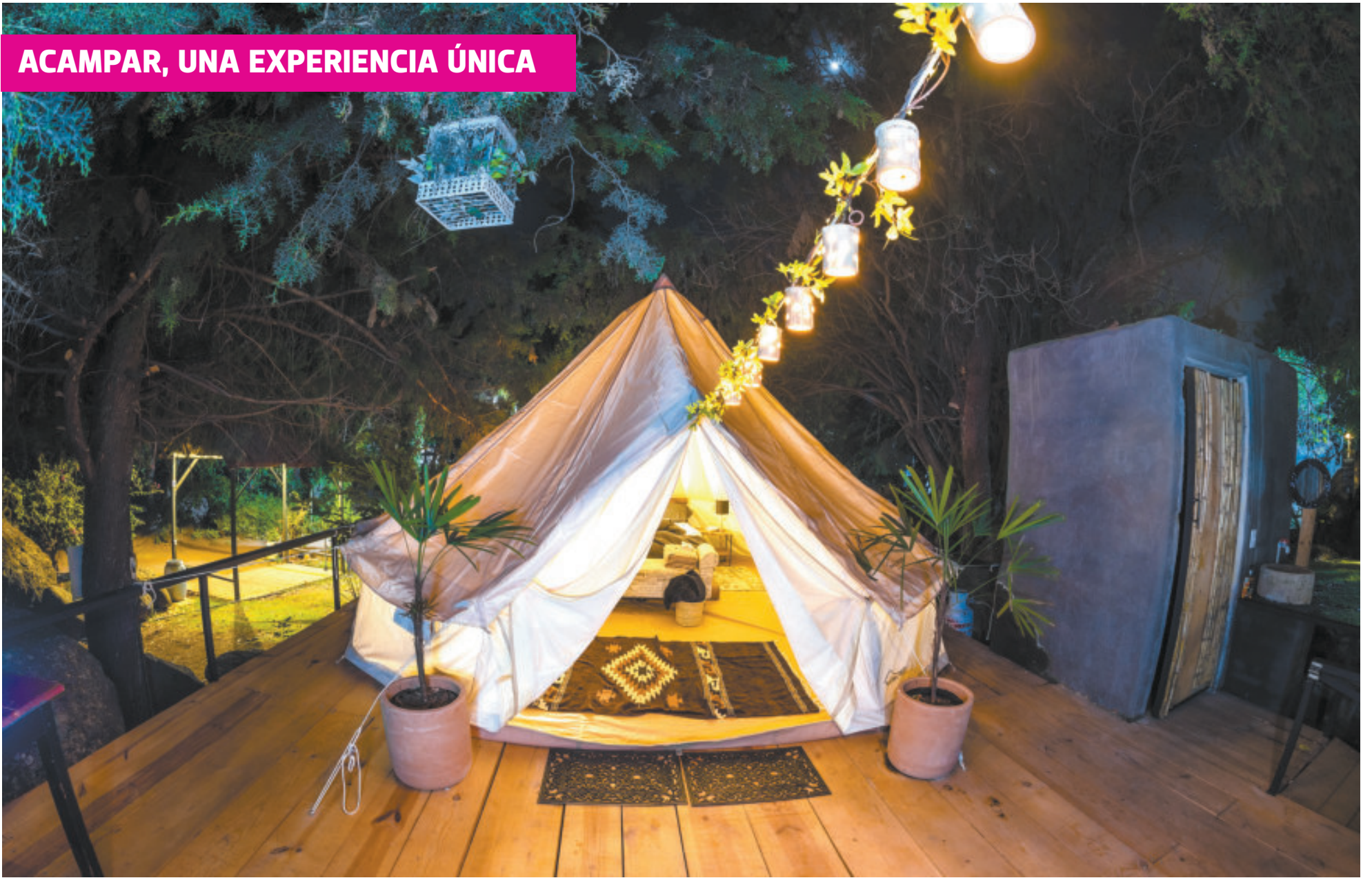
Combina el poder acampar en medio del bosque con todas las comodidades y el lujo.