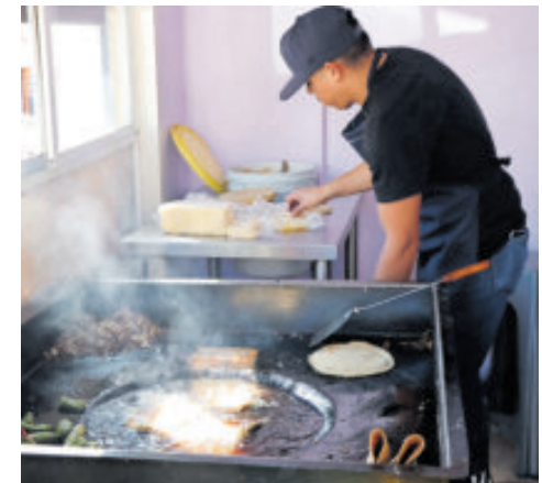
Sólo se pueden encontrar en Zacatecas.